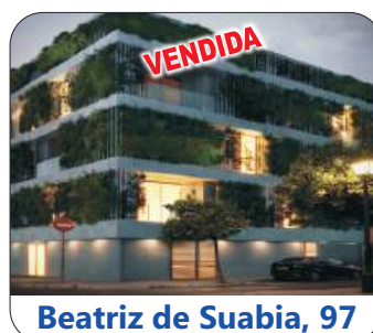
Beatriz de Suabia, 97