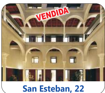
San Esteban, 22