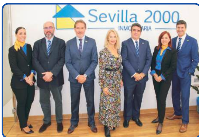
Equipo Directivo Dpto. Obra Nueva