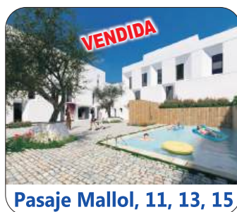
Pasaje Mallol, 11, 13, 15