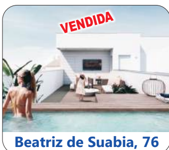
Beatriz de Suabia, 76