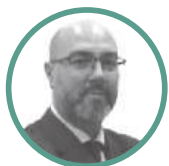
OBRA NUEVA / SUELO