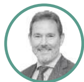
DIRECCION / MARKETING