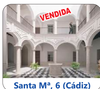
Santa Mª, 6 (Cádiz)