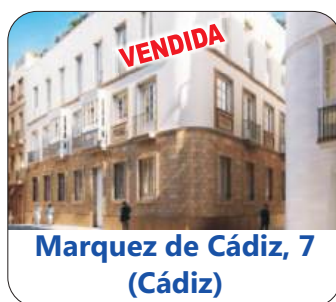
Marquez de Cádiz, 7 (Cádiz)