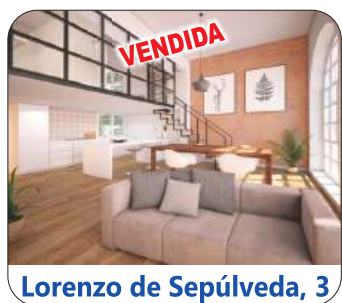
Lorenzo de Sepúlveda, 3