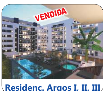
Residenc. Argos I, II, III