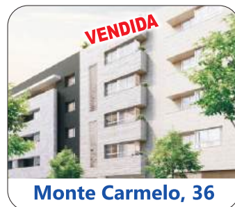
Monte Carmelo, 36