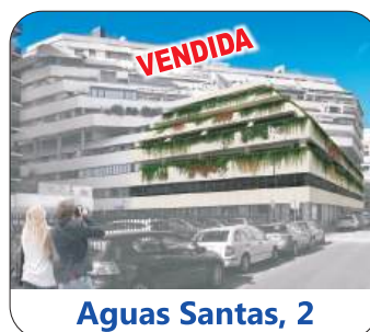
Aguas Santas, 2