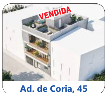
Ad. de Coria, 45