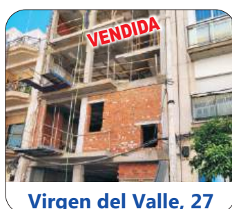
Virgen del Valle, 27