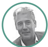
FINANCIERO / JURIDICO